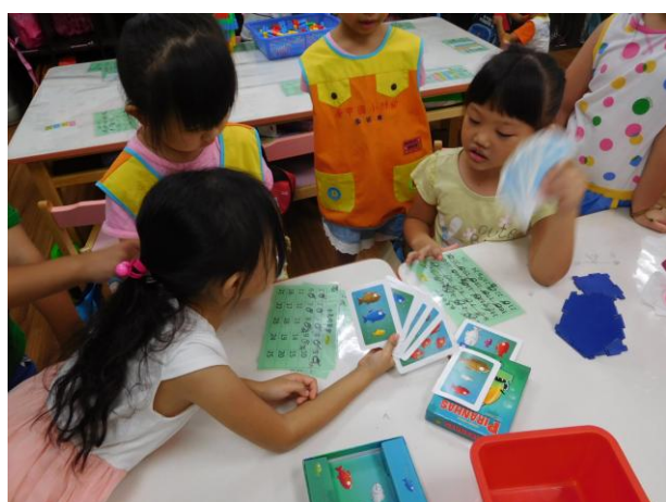
我們在益智區玩抽牌遊戲