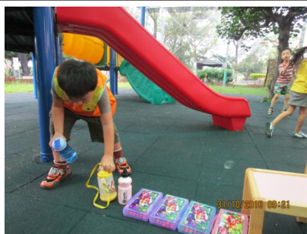
用彩色筆還有水壺測量