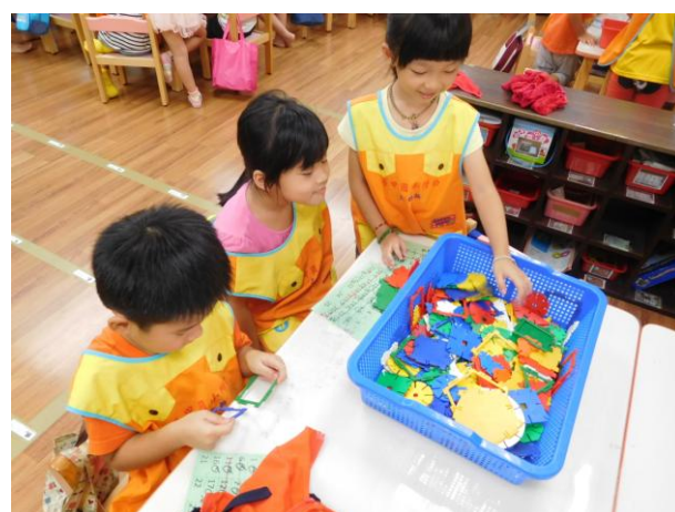
我們在玩組合積木