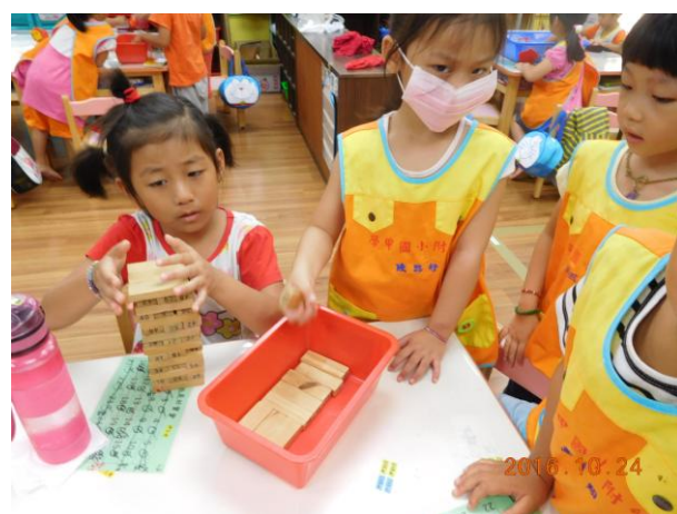
我在益智區疊疊樂