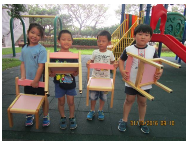
我們用椅子來測量