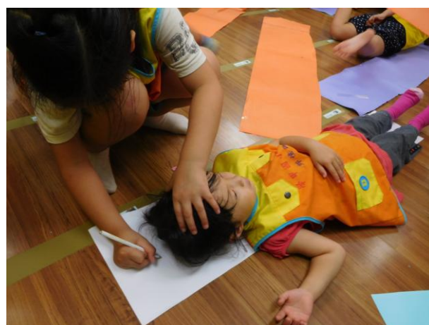
我會幫小妹妹畫身高尺