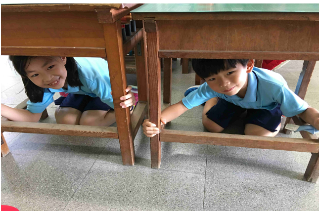
說明：保護頭部及身體，避難掩護的「蹲下、掩護、穩住」3個要領。