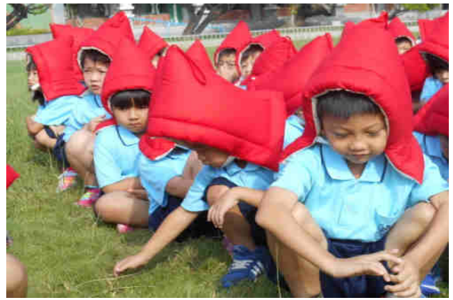
說明：一群可愛的小紅帽乖乖坐在草地上等演習結束