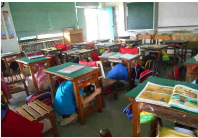
說明：練習以跪坐姿勢躲在桌子下面