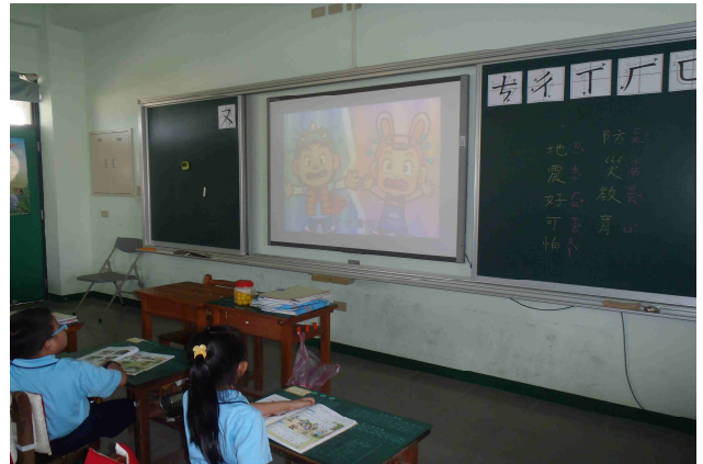
說明：引起動機，撥放地震短片