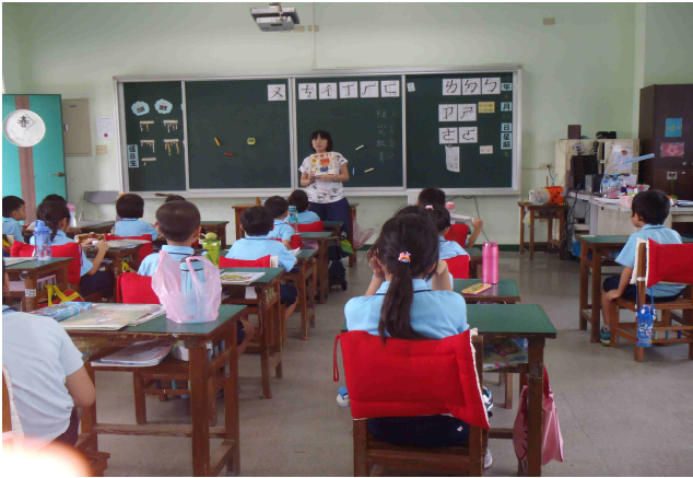
說明：向學生介紹繪本「地震了，這個時候該怎麼辦」