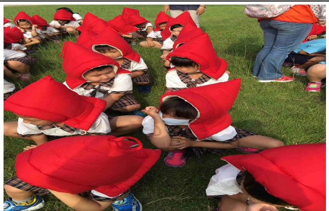
說明：以防災頭套保護頭部，不語、不跑、不推，在師長引導下至安全疏散地點集合。