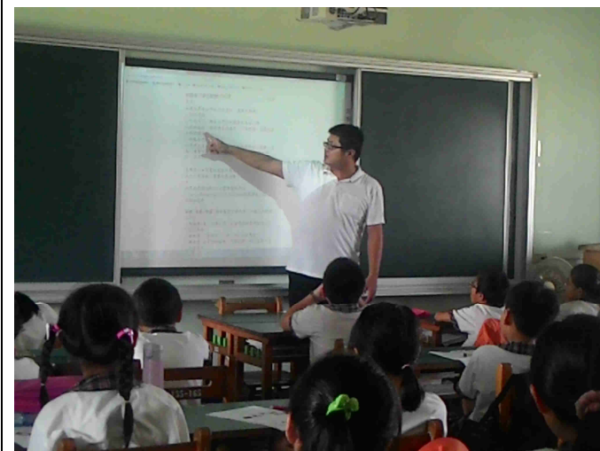
老師講解地震時所應注意的事項