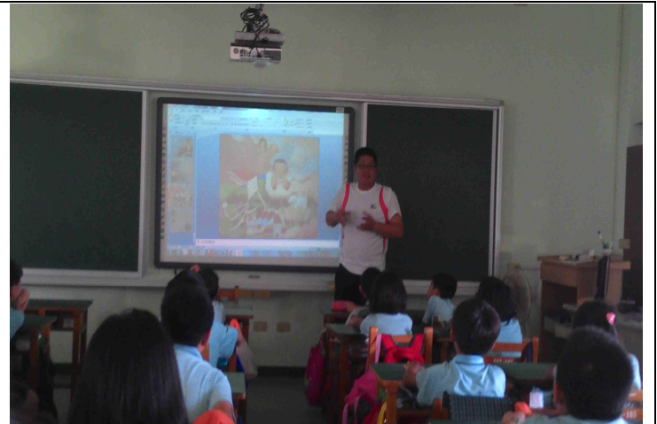
老師解說繪本的內容及背景