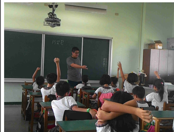
討論防災所需用品