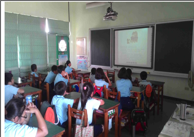
聆聽與觀看「希望的翅膀」繪本