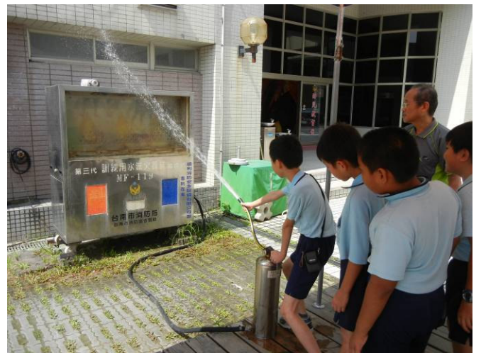
學生實際操作滅火器