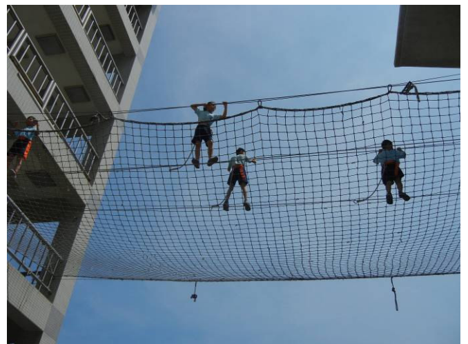
學生實際體驗高空鋼索橫越避難