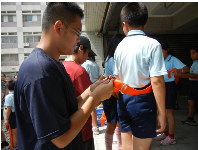
消防隊助教為小朋友繫上防護腰帶並檢查裝備