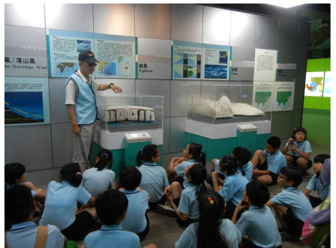
導覽志工說明颱風成因及造成的災害