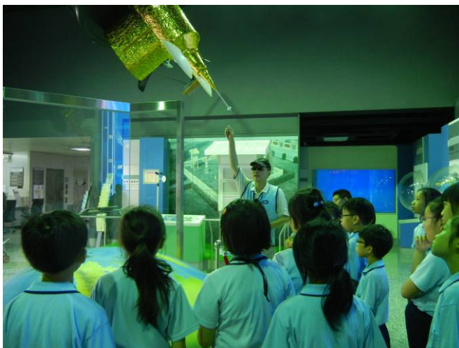
導覽志工說明氣象人造衛星構造及用途