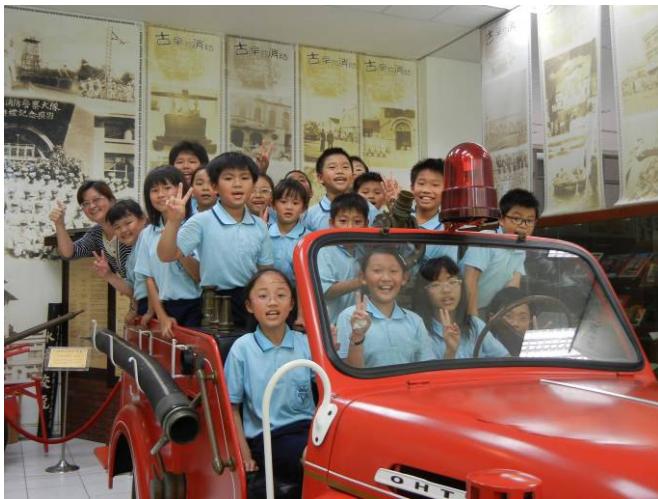
四年乙班師生於具歷史紀念價值之消防車合照