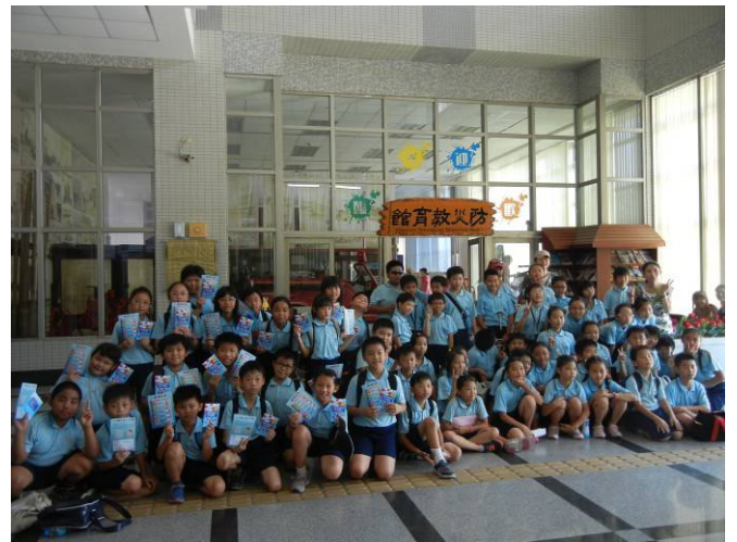
全體師生於防災教育館合影