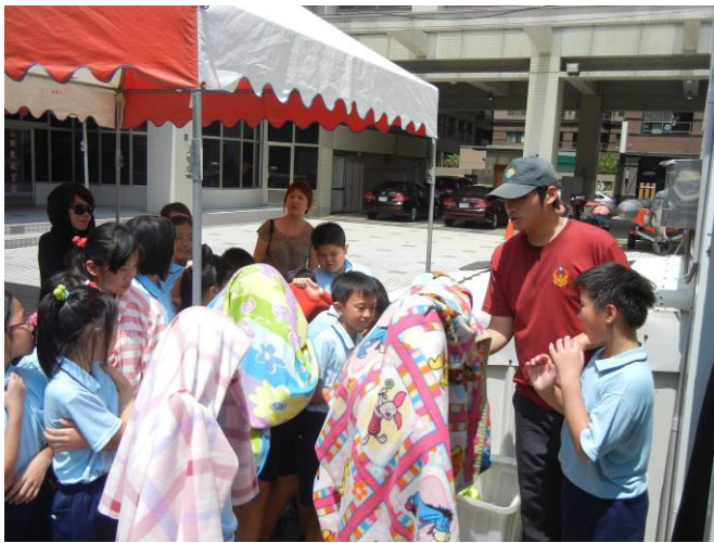
消防隊助教說明火場逃生要領