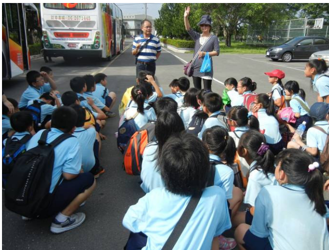
說明防災教育校外教學參觀重點及注意事項