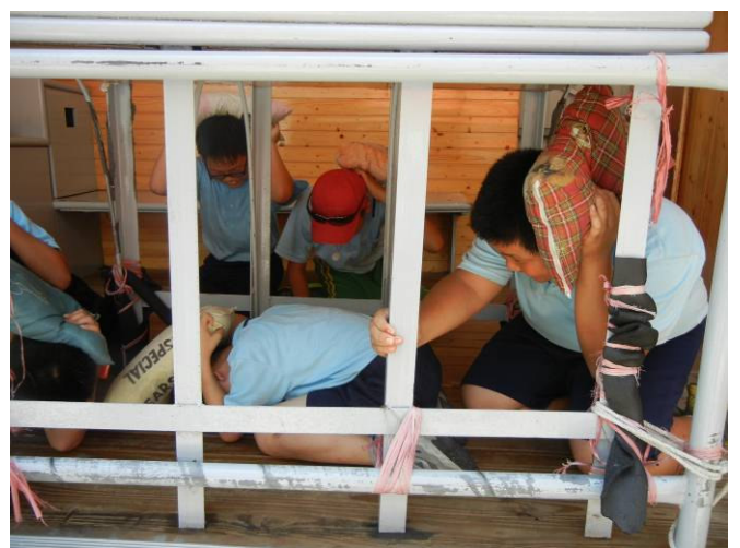
學生於地震體驗屋實際體驗地震避難