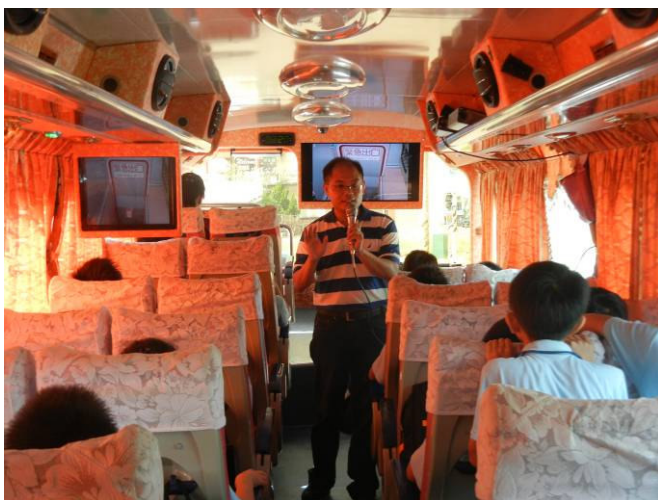
車上說明注意事項及逃生要領