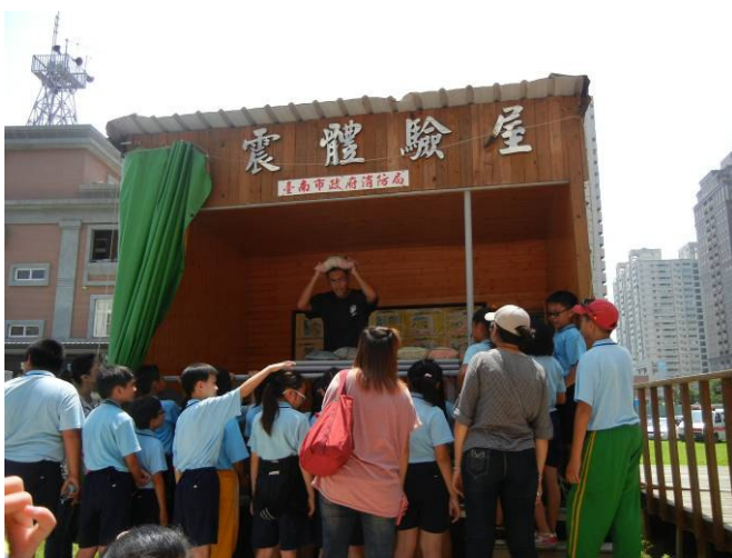
消防隊助教說明地震災害避難要領