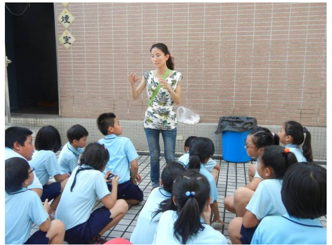
級任老師於體驗活動後，與學生共同討論心得