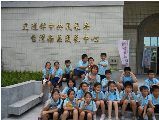
四年甲班全體合影