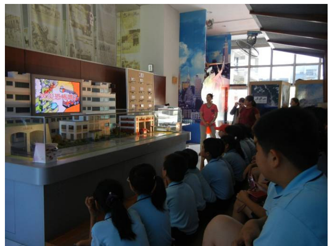
防災教育館-學生聚精會神觀賞火警逃生宣導影片