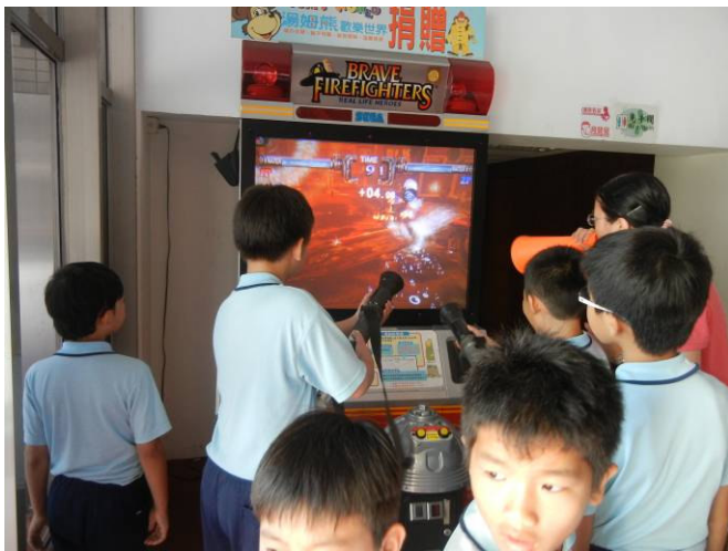
學生運用電子模擬機體驗火場滅火要領