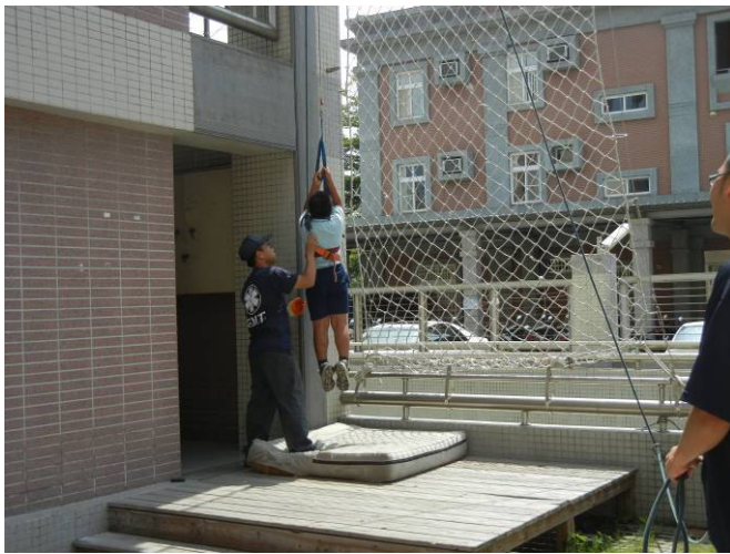
學生實際體驗緩降機從二樓逃生