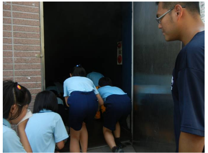
學生進入煙霧室體驗火場逃生要領