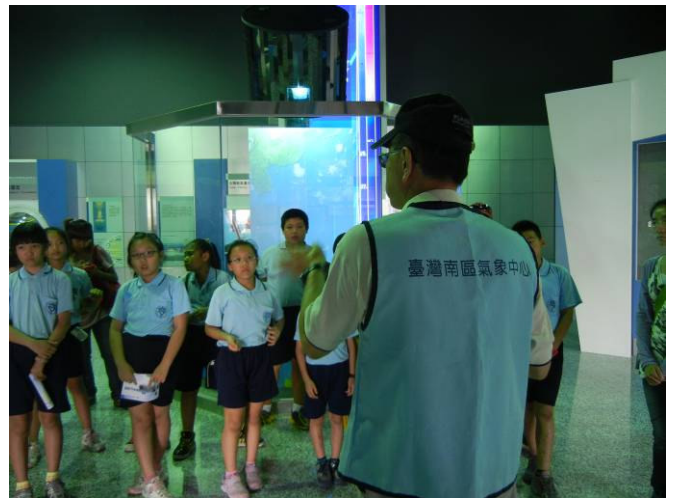
預約導覽志工分組進行導覽解說