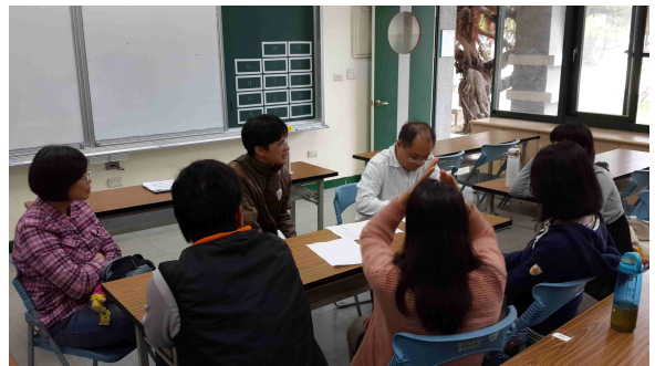
說明：各年段分組討論