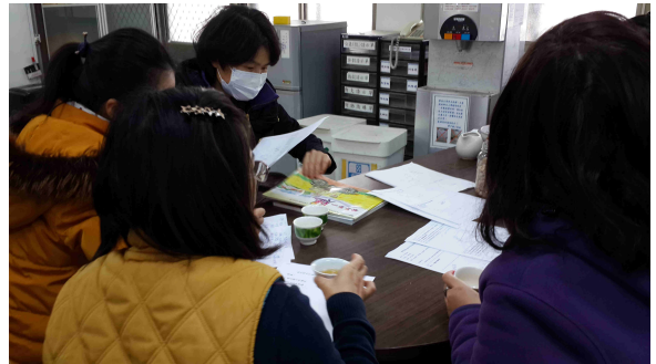
說明：各年段分組討論