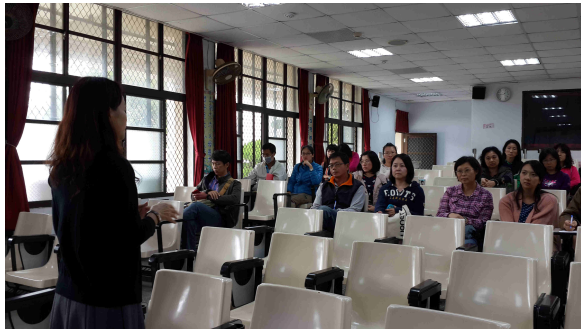
說明：校長說明校本課程的需求性