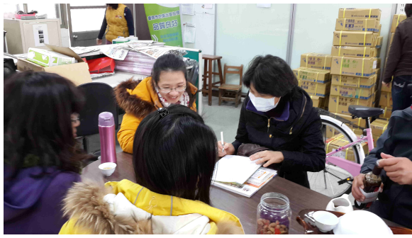
說明：各年段分組討論