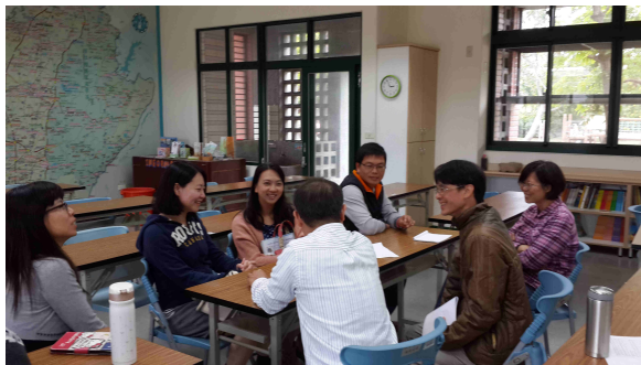
說明：各年段分組討論