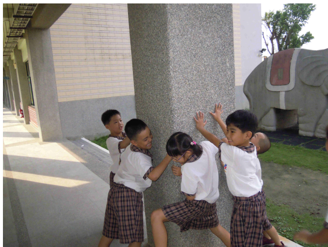
學生非常認真的檢查柱子是否牢固