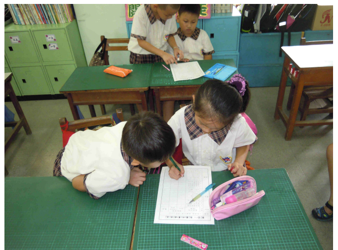
兩人一組完成防震檢核表