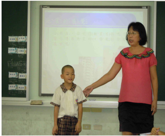
學生發表發生地震時心裡的感觉