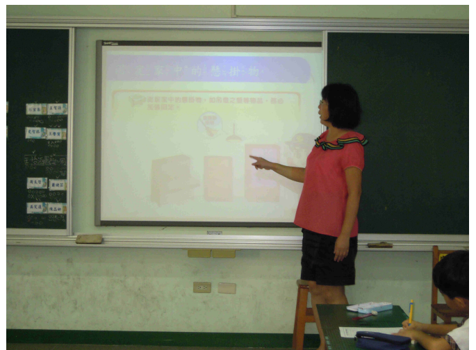
老師舉例說明家庭檢核要點