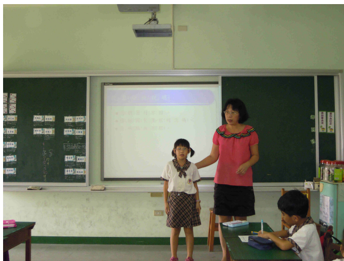
學生發表校園防震檢核要點