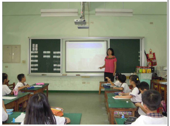
老師再以圖片說明地震帶來的災害