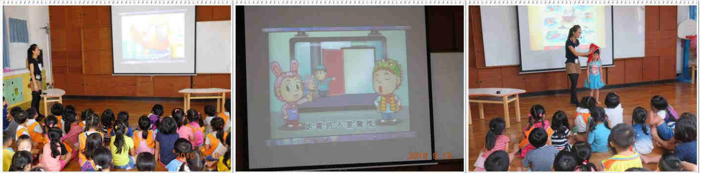
企鵝班佳芬老師進行地震教學課程