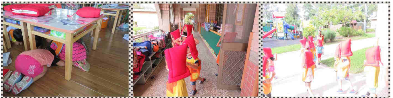
企鵝班幼童進行實地演練