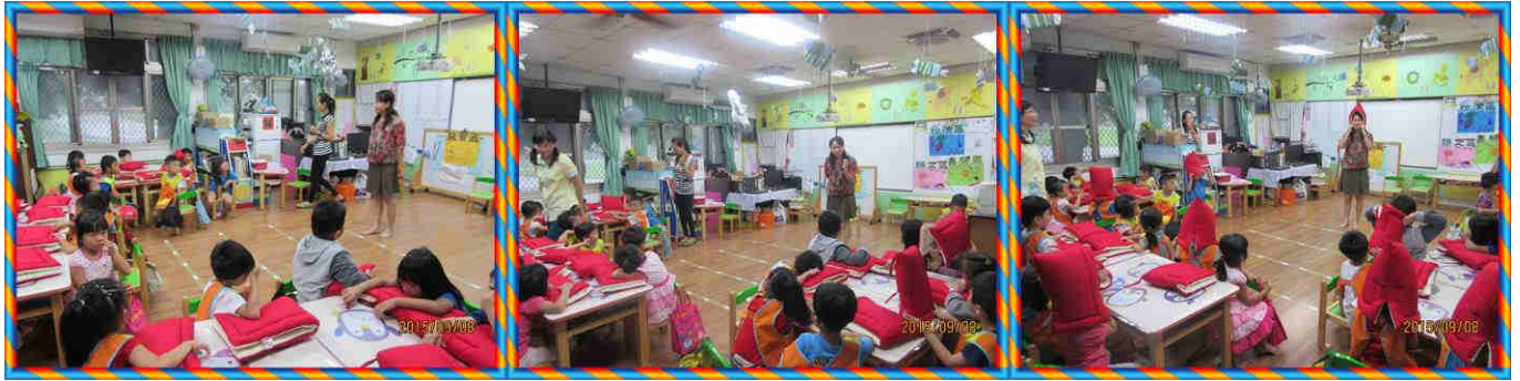
校長親自至企鵝班教導幼童正確防災概念