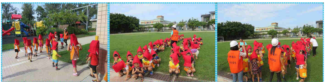
幼童戴著防災頭套進行演練