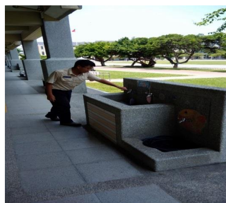
替代役放學巡視校園洗手台