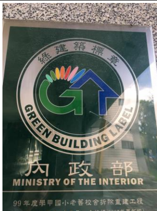
本校大勇樓節能榮獲綠建築標章