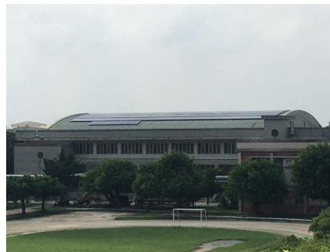
體育館屋頂配合配合市府公有房地設置再生能源發電設備標租案，由李長榮集團公司設置太陽能發電板，併聯太陽能發電系統。