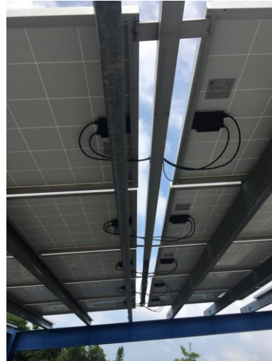
總裝置容量 3.525 峰瓦品