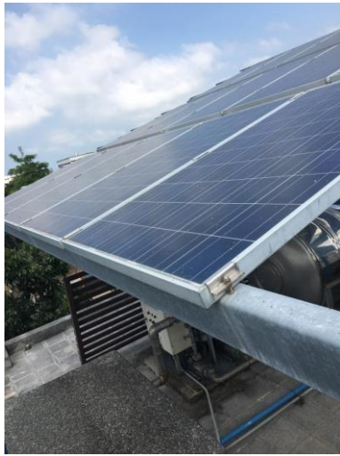
位於本校大勇樓的再生能源設備近照