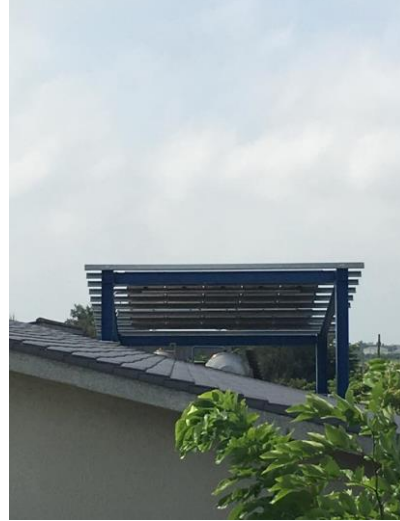
位於本校大勇樓的再生能源設備遠照