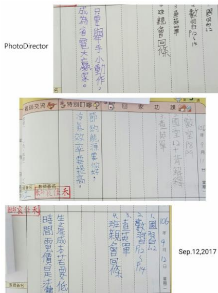
各班利用家庭連絡簿宣導節能減碳 2