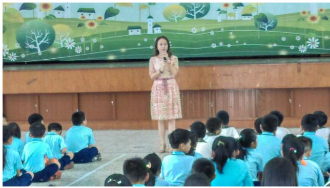
校長利用學生集會宣導節能減碳