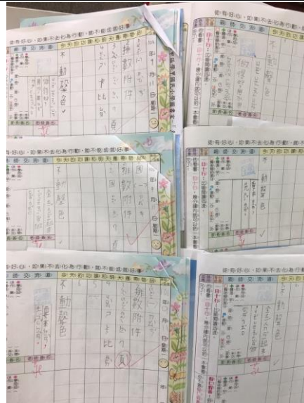
各班利用家庭連絡簿宣導節能減碳 3