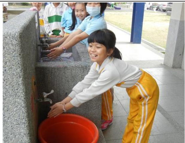
融入校園學習教導費廢水再利用養成節約能源