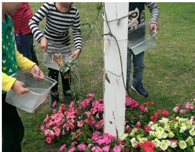
養成洗手廢水澆花的好習慣