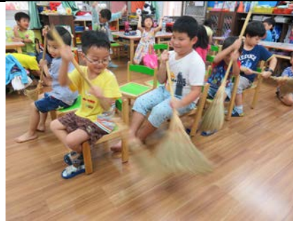
宗蔚說我們最團結