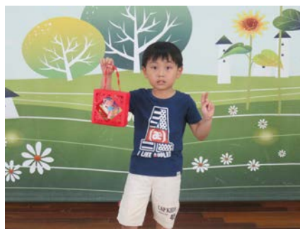
我的窗花組裝完成