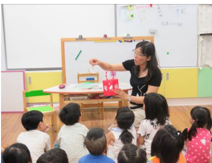
欣賞窗花組裝過程