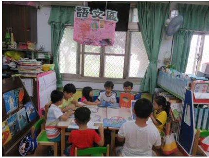
小朋友們認真閱讀