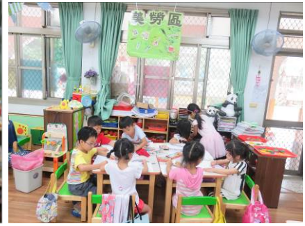
小朋友們一起彩繪龍舟