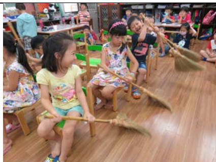
柔蓁說我們用掃把試試