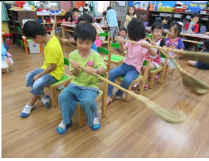
承隆說我最用力划