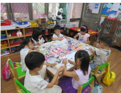
大家一起彩繪龍舟