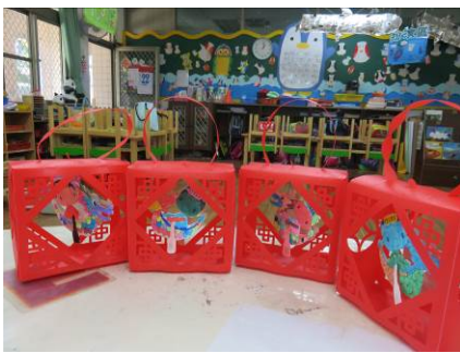
大家的端午節窗花作品