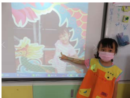
宜眉分享看龍舟賽