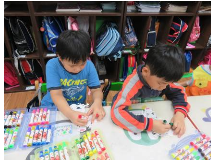
我的龍舟選手最有力