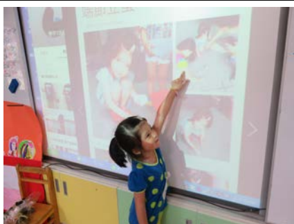
昕辰分享立蛋過程